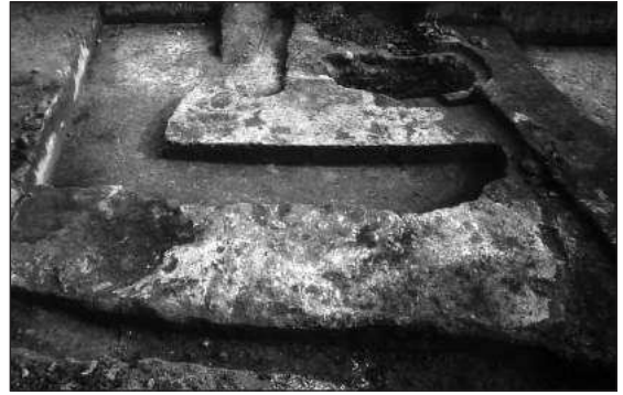
Слика 3 – Сонда 23: минијатурне пећи