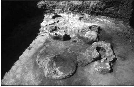
Слика 2 – Кућа 7 са силосом