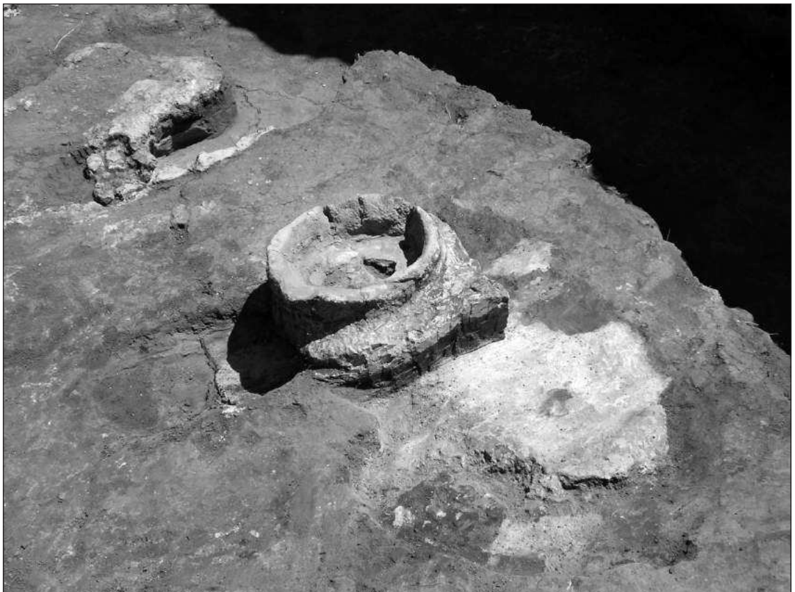
Слика 4 – Сонда 25: квадратне пећи